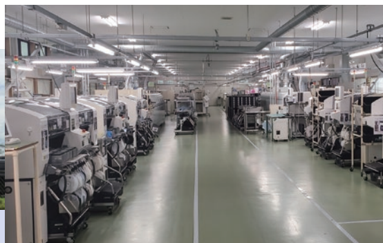
上：整理整頓された那須工場の基板実装ライン。5段階の検査工程を通じて、高品質な電子回路基板を提供している。 右：顕微鏡をのぞき、1/10ミリ精度での手はんだづけも行う。